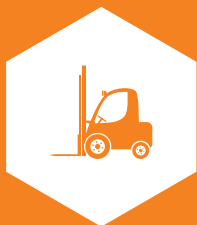
GRÚAS HORQUILLA / MONTACARGAS