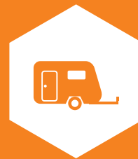
KAMPERY I PRZYCZEPY